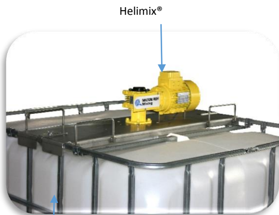
Conteneur 1000 l IBC (non inclus)

Grâce à leurs larges pales déployantes, les agitateurs Helimix® offrent la solution idéale pour le mélange et la remise en suspension de nombreux produits stockés et transportés dans les conteneurs IBC, tels les peintures, vernis, lait de chaux, huiles, sirops, encres, œufs, sorbitol, additifs, enduits, boues, et bien d'autres produits encore!