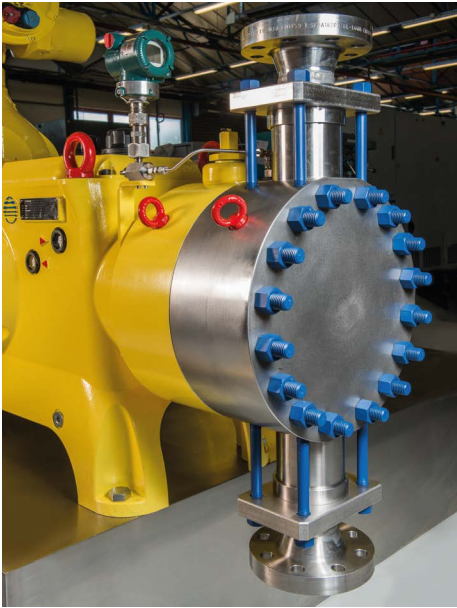
La Primeroyal X ofrece mayor flujo y rangos de presión más altos, hasta 20K PSIG

La nueva bomba Primeroyal X de Milton Roy amplía las capacidades en los entornos más desafiantes en 20K PSIG.