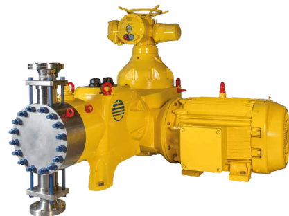
Primeroyal X con cabezal metálico y doble membrana en PTFE (Teflón®), la configuración del motor horizontal y la regulación a través del actuador electrónico integrado.