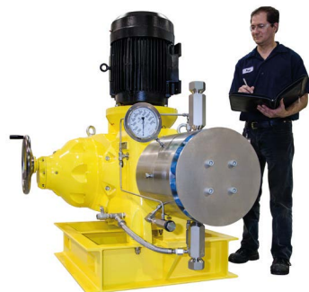
Primeroyal X con cabezal metálico y platos de contorno metálicos con doble membrana, la configuración del motor vertical y el ajuste de la carrera manual.

Si necesita una solución única para todas sus requerimientos de bombeo, es Milton Roy.